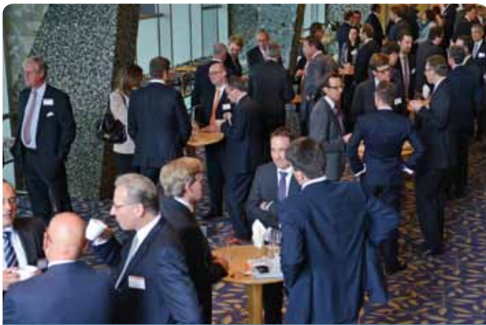
Networking – In den Pausen werden Neuigkeiten ausgetauscht und Kontakte geknüpft oder vertieft.