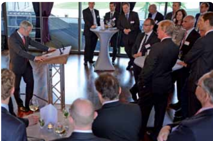
Networking – Gespräche in lockerer Atmosphäre auch bei der exklusiven Abendveranstaltung.

Info-Telefon: 02 11. 96 86 - 33 42 Haben Sie Fragen zu dieser Tagung? Wir helfen Ihnen gern weiter.