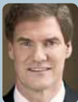
Dr. Carsten Maschmeyer