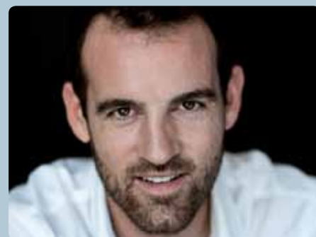
Christoph Metzelder, Christoph Metzelder Stiftung

Christoph Metzelder berichtet über Motivation aus Sicht eines ehemaligen Nationalspielers. Sein Lebensweg spiegelt die für ihn wichtigen Themen Werte, Stiftung und Sport wider.