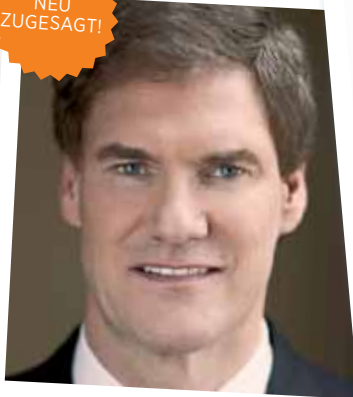
Dr. Carsten Maschmeyer Maschmeyer Group