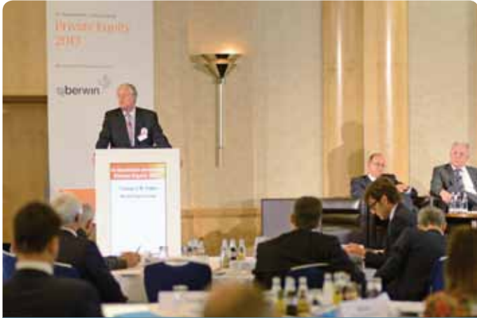
Diskutieren Sie die aktuellen Themen der 14. Handelsblatt Private Equity Jahrestagung!