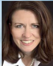
Martina Ochel Genzyme GmbH

medizinische & industrielle BIOTECHNOLOGIE get biotechted! Co-Location mit der 1. WiWo-Konferenz „Industrielle Biotechnologie“