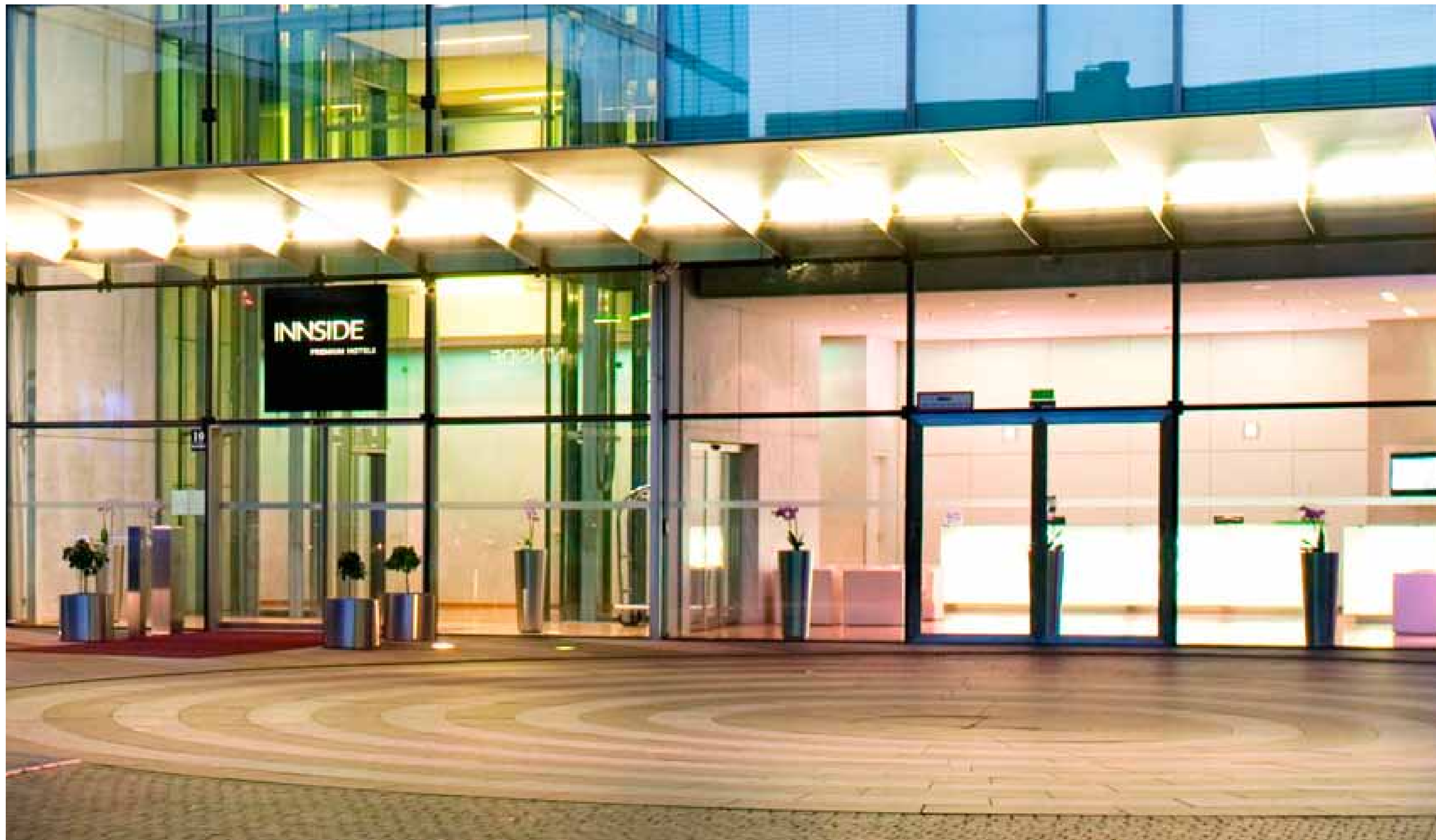
„INNSIDE München Parkstadt Schwabing“, Mies-van-der-Rohe-Straße 10, 80807 München