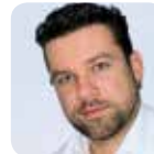
MANN+HUMMEL GmbH Anton Belmann