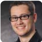
ARNOLD Umformtechnik GmbH & Co. KG Daniel Schmidt