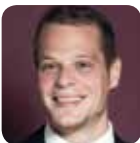
AUDI AG David Costerousse