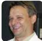
Continental Teves AG & Co.oHG Peter Krines