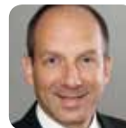
Petrofer Chemie H.R. Fischer GmbH & Co.KG Dr. Florian Treptow