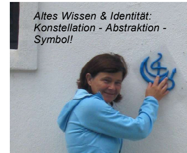
Altes Wissen & Identität: Konstellation - Abstraktion - Symbol!