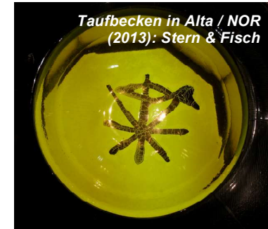
Taufbecken in Alta / NOR (2013): Stern & Fisch