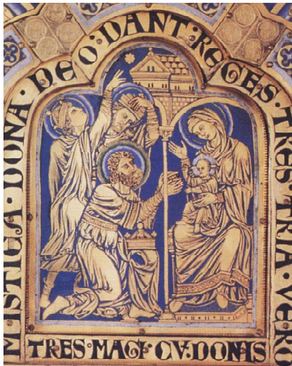
"Drei Magier mit Geschenken" (mit Hinweis auf den Stern nach Matth.2,2) - eine von 51 Gold-Email-Tafeln im "Verduner Altar", 12. Jhdt., Klosterneuburg, Austria

(21.12.2020), bzw. ihrer sogenannten "Großen Konjunktion", ab Mai 2023 wieder am Morgenhimmel sichtbar, - aber längst in Sternbild-Nachbarschaft. Und weil ein Gipfeltreffen beider "Planetengötter" erst 2040 wieder sichtbar wird, werden wir uns ihrem kulturprägendem Ablauf nochmal zu. Gern wird über ferne Galaxien, schwarze Löcher o.ä. geplaudert.