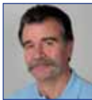
Heiner Brand DHB-Trainer