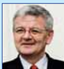
Joschka Fischer Bundesaußenminister a.D.

Treffpunkt Zukunft – Europa im globalen Wettbewerb