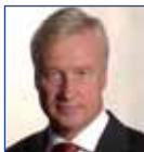
Ole von Beust Erster Bürgermeister der Freien und Hansestadt Hamburg

Willkommen in der Logistik-Metropole Hamburg Begrüßung durch den Ersten Bürgermeister