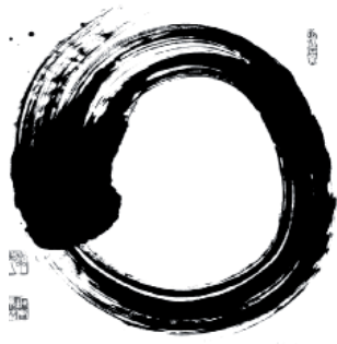
Enso, der Kreis © by Sanae Sakamoto

Ergänzend zu den gemeinsamen Meditationen, den Referaten (Teisho) und dem Austausch besteht in diesem Seminar die Möglichkeit zu Einzelgesprächen (Dokusan). In dieser Begegnung können Erfahrungen in der Meditation geklärt und eine individuelle Begleitung sichergestellt werden. Der Erfahrungsbericht einer Führungspersönlichkeit trägt zur Konkretisierung des Zen-Weges im Businessalltag bei.