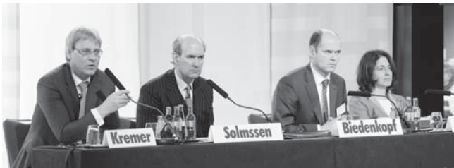
Das hochkarätig besetzte Podium der „Unternehmensjuristentage 2009“