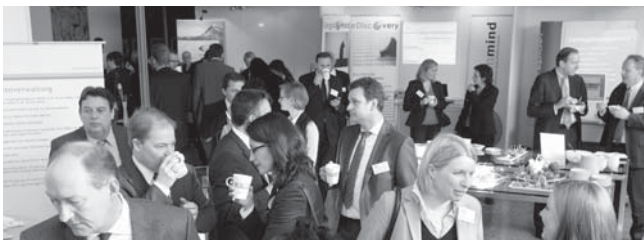
Die begleitende Fachausstellung bot den Teilnehmern Gelegenheit, sich untereinander auszutauschen