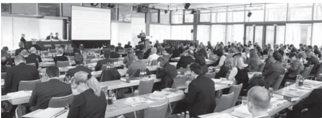
Das interessierte Publikum hörte Vorträge zu aktuellen Themen