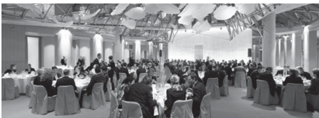
Bei dem exklusiven Abendessen in außergewöhnlichem Ambiente wurden Kontakte geknüpft