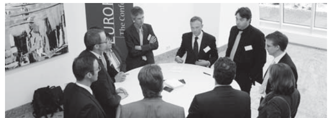
Zum Abschluss der Tagung fanden vertiefende Gespräche zu Einzelthemen in kleinen Gruppen statt