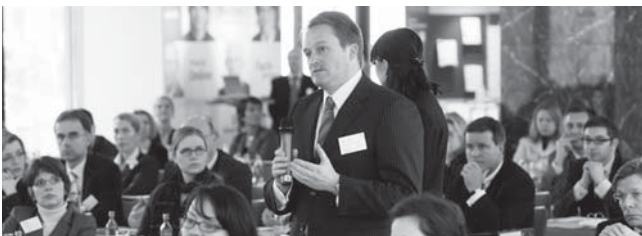
Die Teilnehmer nutzten die Gelegenheit, mitzudiskutieren und den Referenten Fragen zu stellen

Zum Abschluss der Unternehmensjuristentage lädt EUROFORUM Sie herzlich zu einem Umtrunk ein.