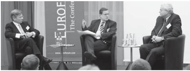
Beim exklusiven Vortragskreis am Vorabend wurde in ungezwungener Atmosphäre lebhaft diskutiert