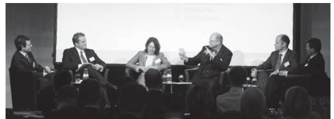
Während der Podiumsdiskussion wurden Erfahrungen ausgetauscht