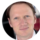
Alexander Strecker Alexander Strecker Management Consulting & Training