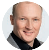
Jan Köhler Köhler Kommunikation Werbeagentur GmbH