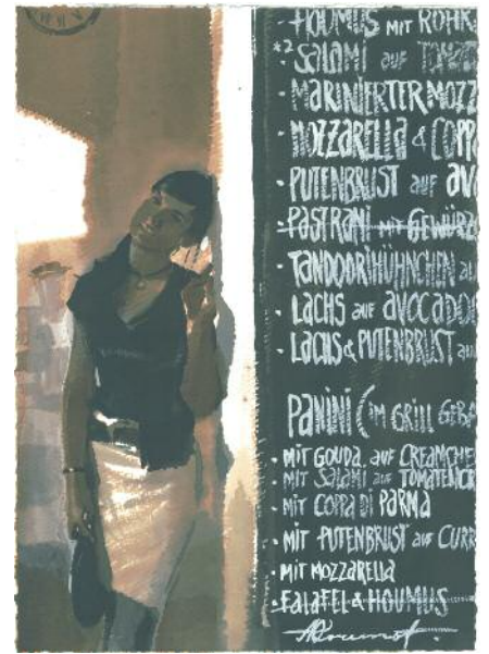
Alexander Kotchetow, „Menue“, Tusche/ Gouache auf Papier, Format 39,5 x 28,5 cm, handsigniert, Passepartout, gerahmt in Natur-Holzleiste (unlackiert), 3.400 Euro zzgl. 25 Euro Versand