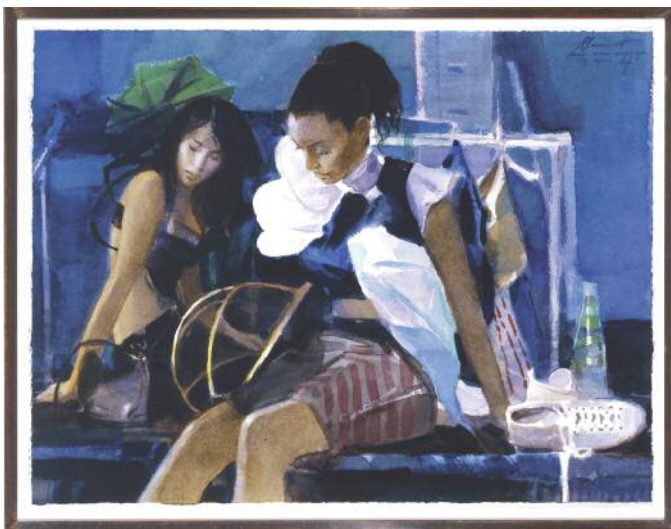
Alexander Kotchetow, „Nach der Modenschau“, Aquarell auf Papier, Format 31 x 40 cm, handsigniert, gerahmt, 4.200 Euro zzgl. 25 Euro Versand

EXKLUSIV FÜR LESER ZUM KAUF: 6 originale Kunstwerke von Alexander Kotchetow Anfragen an: ArteViva Kunst & Design, Dagmar Gold, Tel. 080 27/9 08 99 33, Fax 080 27/9 08 99 32, contact@arteviva.de Fordern Sie auch Angebote mit weiteren Bildern des Künstlers an!