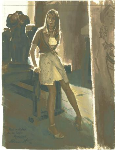
Alexander Kotchetow, „Mari im Atelier“, Aquarell auf Papier, Format 31 x 40 cm, handsigniert, gerahmt, 4.200 Euro zzgl. 25 Euro Versand