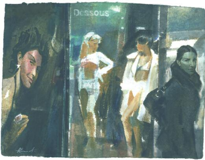
Alexander Kotchetow, „Schaufenster“ aus der Serie „Spiegelung“, Aquarell auf handgefertigtem Papier, Format 58 x 77 cm, gerahmt in handgefertigter schwarzer Holzleiste mit Silber, 6.400 Euro zzgl. 45 Euro Versand