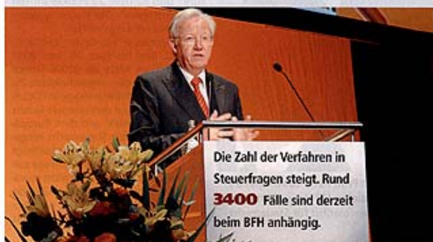
Wolfgang Spindler: Der Präsident des Bundesfinanzhofs (BFH) beklagt, selbst Steuerexperten haben keinen zuverlässigen Überblick mehr über das Rechtsgebiet

Quelle: „Studie KMU und ihre Steuerberater“, www.profilma.de