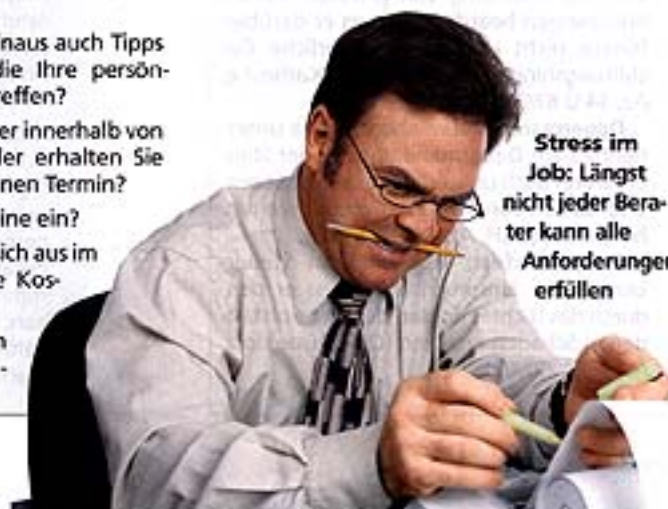
Stress im Job: Längst nicht jeder Berater kann alle Anforderungen erfüllen