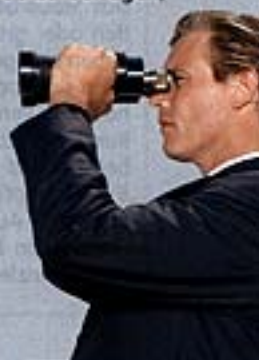
Beratersuche: Keine leichte Sache – wie Mandanten vorgehen

Branchen er bedient. Oft genügt auch ein Anruf, um die entsprechenden Informationen zu erhalten. Beides kann einen ersten Eindruck vom Angebot des Büros vermitteln.