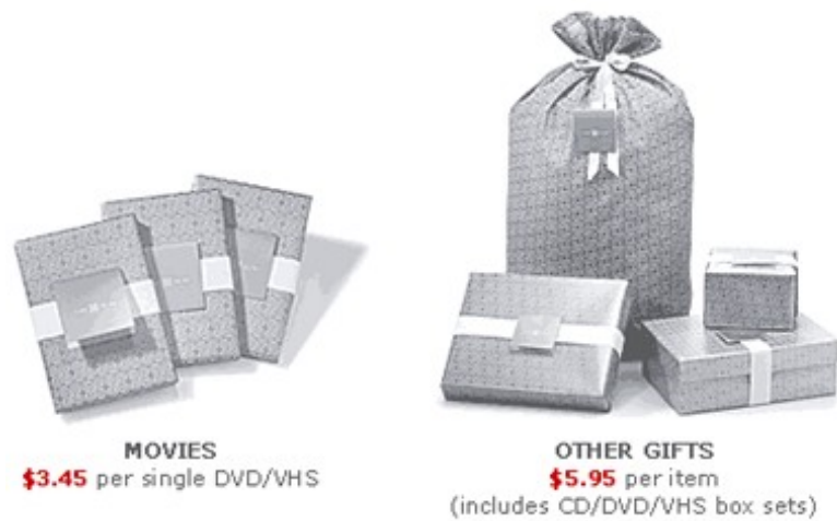
Abbildung 1: Target.com zeigt detailliert, wie die Geschenkverpackungen aussehen werden