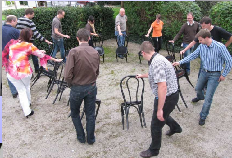
Der Energizer „Stuhlkipübung“ – immer wieder eine willkommene Abwechslung!